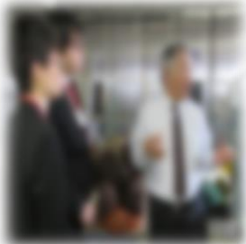
5月21日 社内での説明会