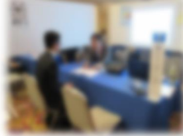
5月18日 朝日大学合同企業説明会