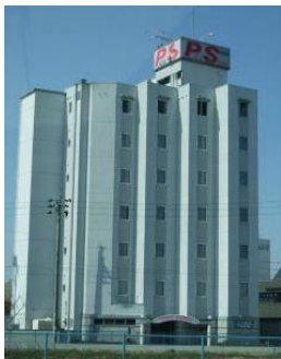
ホテル PS 愛知県稲沢市