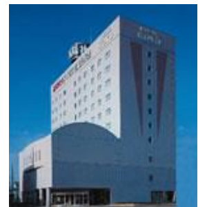
高陽社 別館 岐阜県羽島市