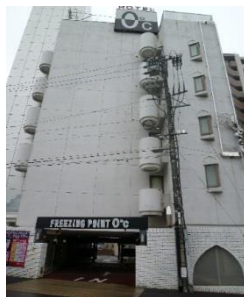
ホテル 0°C 愛知県名古屋市